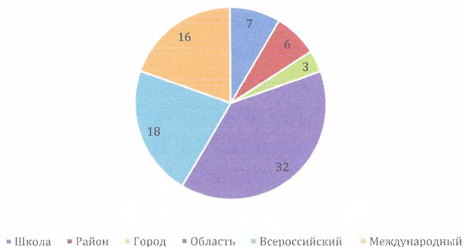
Достижения по направлениям