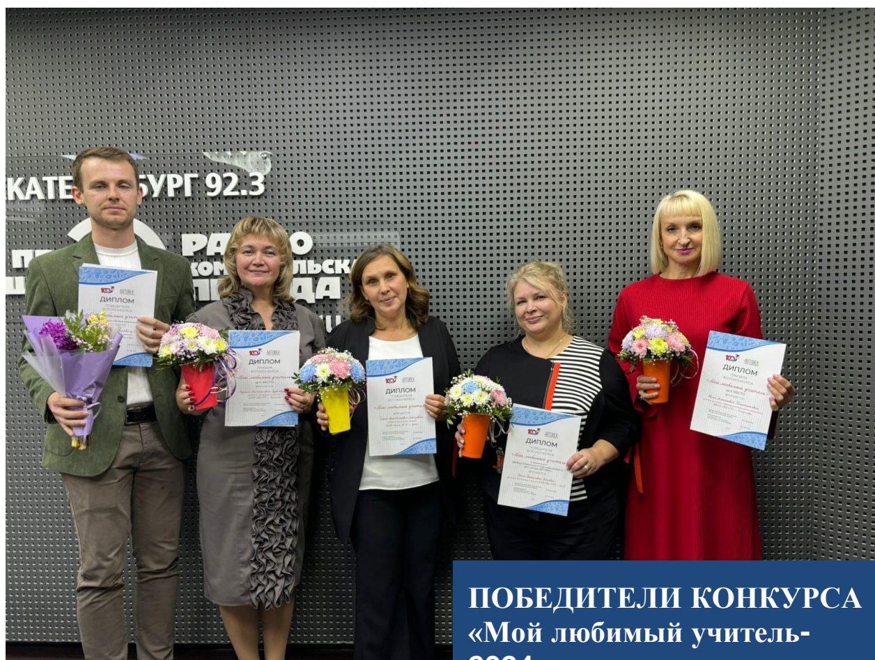
ПОБЕДИТЕЛИ КОНКУРСА «Мой любимый учитель-2024»