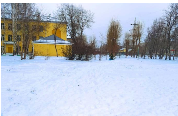
АБДУЛЛА ИГНАТОВИЧ. Зимний двор